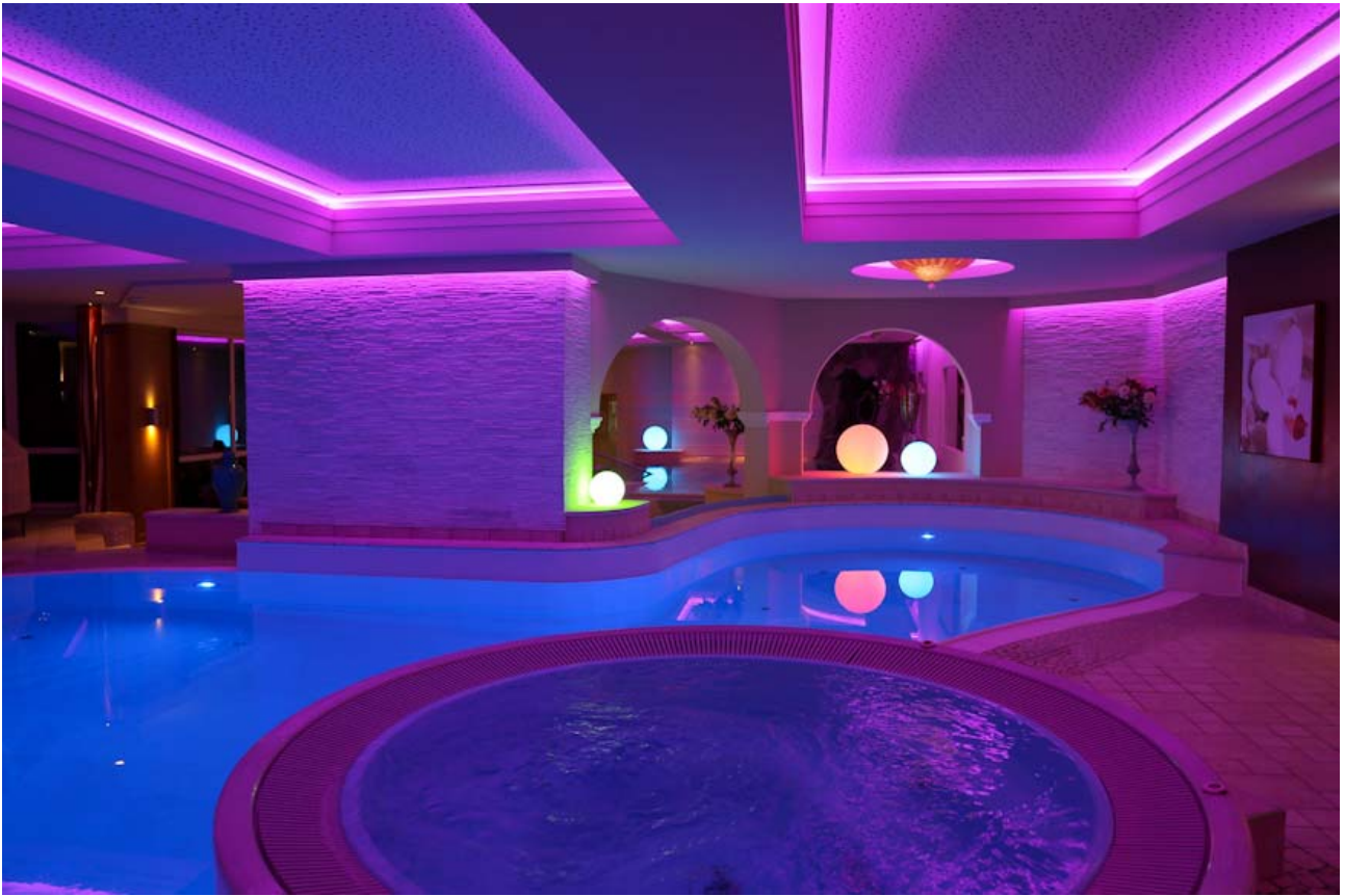
Mit stylishem Wellnessbereich und violett-blau illuminiertem Hallenbad zog das Hotel Panorama einst seine Gäste aus Deutschland, Österreich, der Schweiz und Italien an.